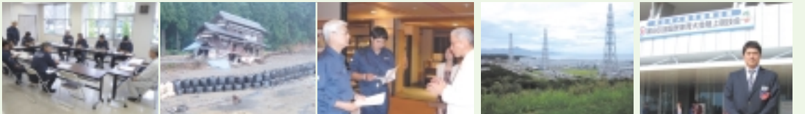
建設公安委員会県内行政視察（十日町、南魚沼、魚沼災害視察）