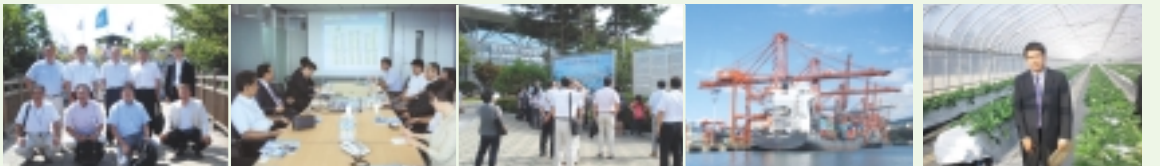
自民党青年局海外研修（韓国・釜山港）